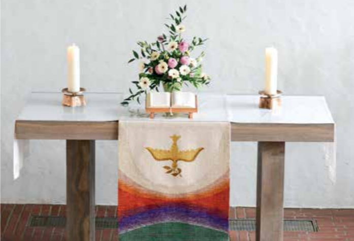
نمای داخلی از محراب یک کلیسا در سوئیس